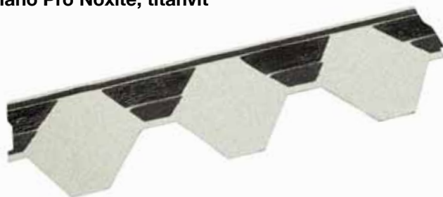
Plano Pro Noxite, titanvit