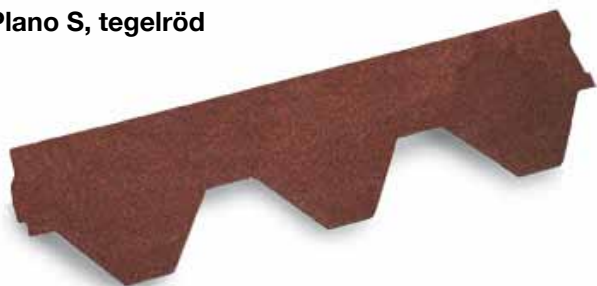
Plano S, tegelröd